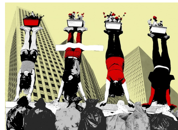
Fotografika, hommage pesniku Srečku Kosovelu (izdelek dijakinj ART in GIM, projekt Dan ustvarjalnosti)

Aranžer – kdor poklicno kaj ureja v skladno, estetsko celoto.