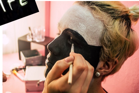
Pustne poslikave (priprave na šolsko pustovanje)